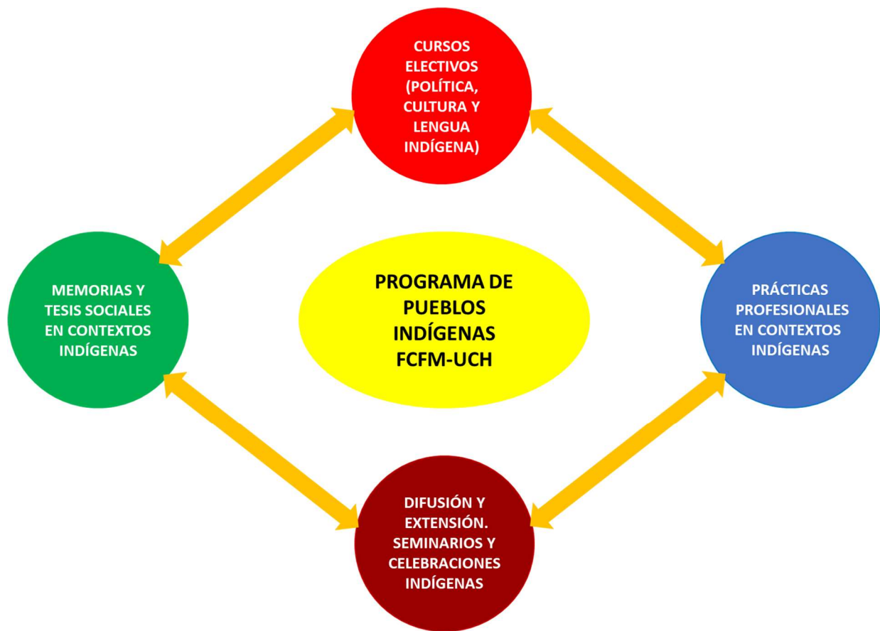
Figura N° 3: Ámbitos de acción del Programa de Pueblos Indígenas FCFM y sus relaciones sinérgicas, que potencian las áreas de docencia, innovación y extensión de la FCFM.