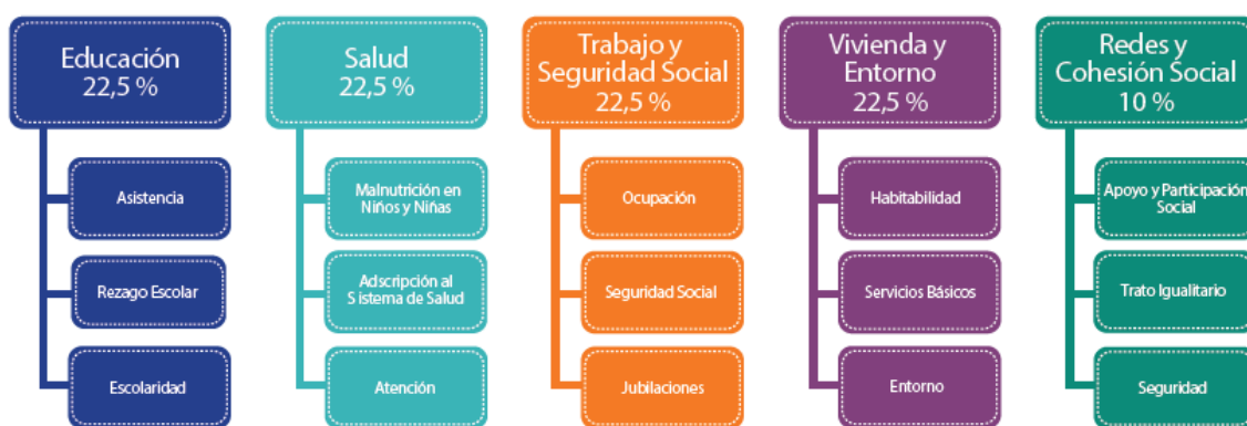
Ilustración 2: Dimensiones e indicadores de la medición de pobreza multidimensional