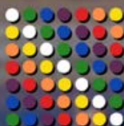
AYMARA QUECHUA LICKANANTAY