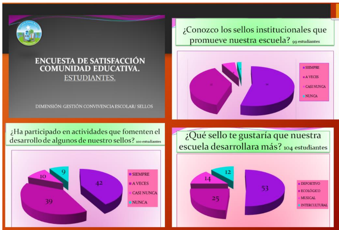
Figura 4: Encuesta de satisfacción comunidad educativa dirigida a estudiantes. (Escuela Costa Blanca, 2020)